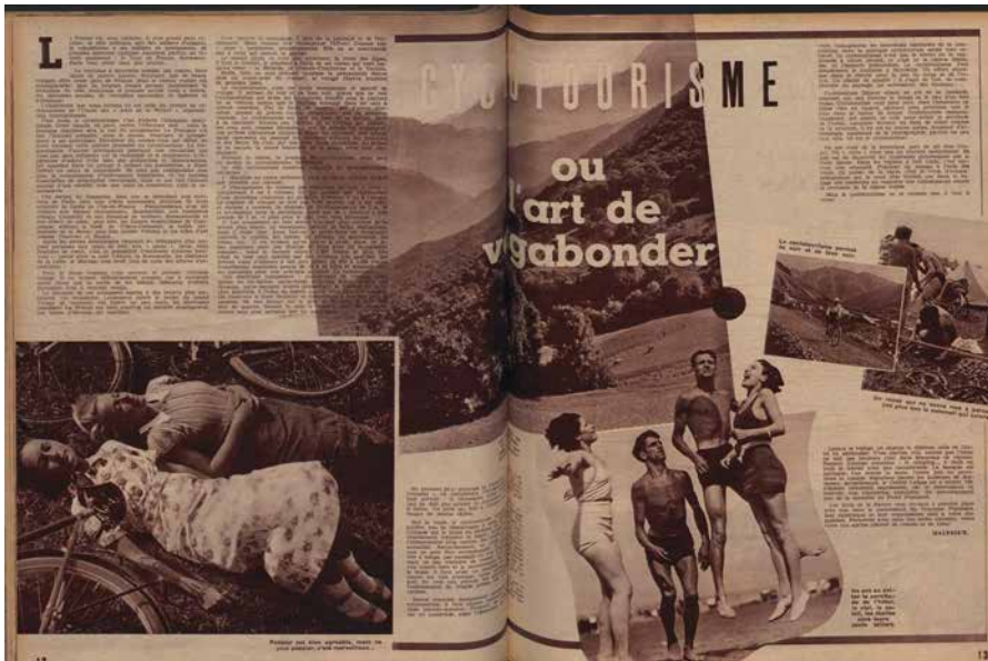
Article sur les congés payés dans le magazine Regards du 13 août 1936.

sein de la Chambre des députés. Le fait d'être exclu du gouvernement ne signifie donc pas que les socialistes n'aient eu aucune influence sur le cours des choses jusqu'en 1936. En revanche, il est bien vrai qu'en accédant au gouvernement et directement au pouvoir exécutif, l'expérience change complètement de dimension.