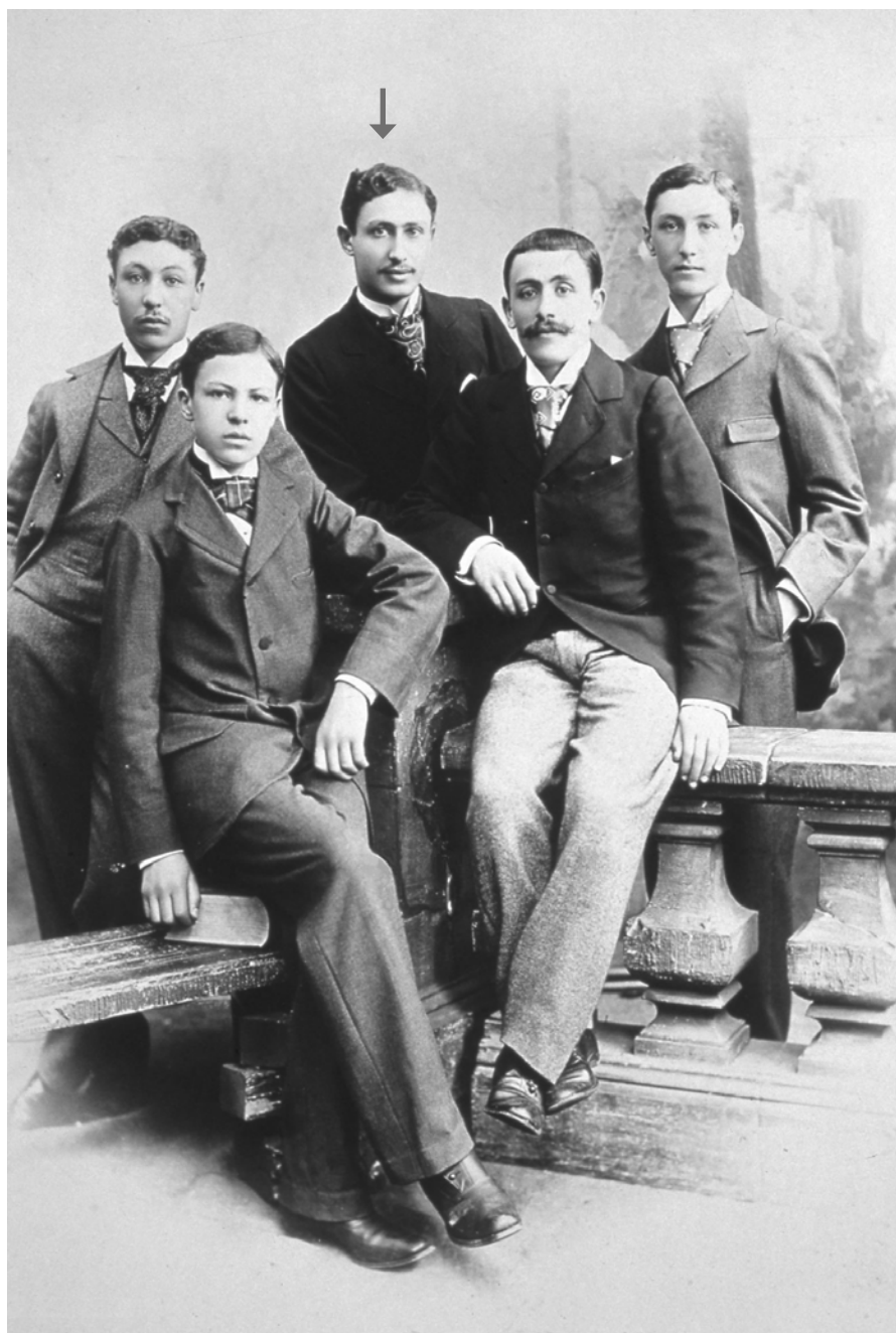
Léon Blum et ses frères vers 1890. De gauche à droite : Marcel, René (assis au premier plan), Léon, Lucien (assis) et Georges.