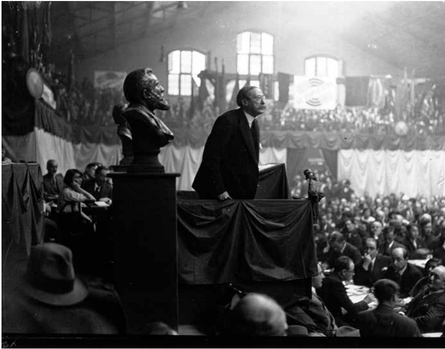
Congrès socialiste de 1932 : discours de Léon Blum , Bibliothèque nationale de France.

Cette période correspond pour Blum à un moment de lutte aussi contre certaines fractions dissidentes chez les socialistes et il se méfie particulièrement de la scission des néo-socialistes emmenée par Marcel Déat dont il voit les éléments de tentation autoritaire 20 . L'époque confronte aussi Blum à la crise politique de 1934 et aux divers projets de réforme de l'État. Après l'émeute du 6 février, la chute du ministère Daladier et la formation du gouvernement d'union nationale sous la houlette de l'ancien Président de la République Gaston Doumergue, Blum écrit un article dénonciateur dans Le Populaire du 16 février intitulé : « Le gouvernement de Bloc national et de fascisme ». Il rappelle alors qu'« en France, l'antiparlementarisme, ou plutôt l'exploitation de l'antiparlementarisme latent a toujours été une des manœuvres préférées des factions césariennes » 21 . À l'annonce des projets de réforme de Doumergue à l'automne, il s'enflamme en mobilisant des références historiques de la seconde moitié du XIX e siècle : « Jamais, depuis l'Empire, fût-ce sous l'Ordre moral, on n'avait entendu pareil langage. Le ton de patelinage, de fausse bonhomie, d'astuce familière n'y change rien. Un homme se