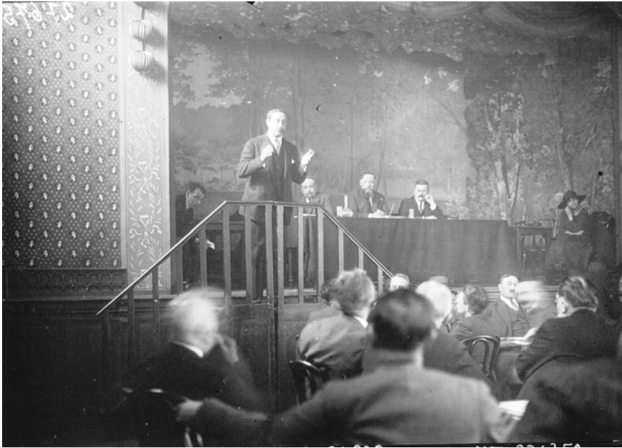
Congrès national socialiste de 1924 : discours de Léon Blum

1914 est, pour la France comme pour Léon Blum, l'année tournant, celle de la mise en harmonie et en mouvement de ce qui pouvait apparaître comme des composantes désordonnées de sa personnalité.