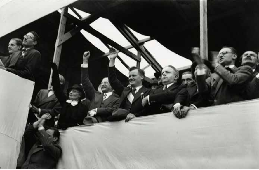
Discours de victoire du Front populaire, place de la Nation, Paris, 14 juillet 1936

Il reprend cette analyse lors du débat très tendu tenu au Sénat en avril 1938 lorsque son second gouvernement s'apprête à être renversé. Le président de la Chambre haute, Jules Jeanneney l'interpelle : « Monsieur le président du Conseil, je suis obligé de vous rappeler à une interprétation plus exacte de la loi constitutionnelle » mais s'attire une vive réponse de Blum :