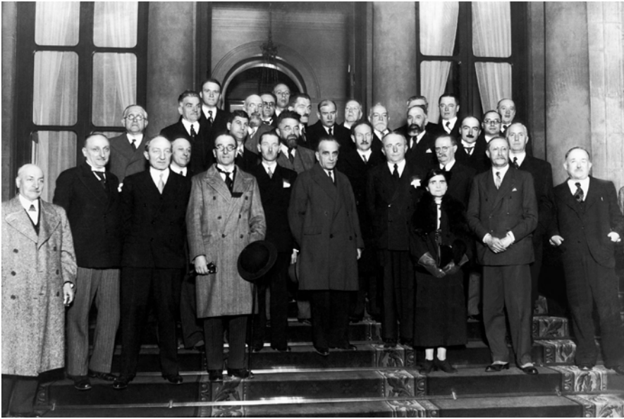
Le gouvernement Léon Blum en juin 1936.

d'émancipation pour tous, la démocratie, pour leur préférer l'ordre, l'autorité, la nation ? Au fond, les grands objectifs d'émancipation importeraient moins au socialisme que la question de son efficacité. « Je suis épouvanté », dit Blum en 1933, à l'écoute de ce type de discours, et je pense que l'exclusion d'une partie de ces néo-socialistes, qui doivent quitter le parti en 1933, est aussi une manière pour Blum de rappeler que la transformation totale du parti, sa modernisation ne pouvaient signifier l'abandon de ce qui constituait son identité, et je le répète, son objectif à la fois de démocratisation et d'émancipation intégrales.