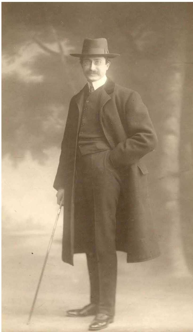
Léon Blum à l'époque du Conseil d'État, vers 1914, Fondation nationale des sciences politiques, fonds Léon Blum.